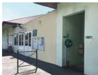
Défibrillateur Salle Georges Daviet