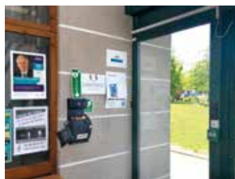
Défibrillateur Espace 2000

Un accident est vite arrivé... Si vous vous trouvez en présence d'une personne qui ne respire plus, ou dont le cœur ne bat plus, vous avez la possibilité d'intervenir en attendant l'arrivée des secours grâce à plusieurs défibrillateurs installés dans la commune à trois lieux clés ! Vous en trouverez un dans le hall d'entrée de l'Espace 2000, un devant la salle Georges Daviet, et un dernier au rez-de-chaussée de la Halle des Sports et de la Culture.