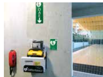
Défibrillateur Halle des sports