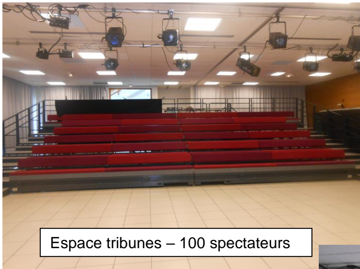
Espace tribunes – 100 spectateurs