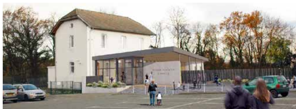
Projet d'AER Architectes pour l'école d'Avully

La fin des travaux est prévue pour Décembre 2018, puis le réaménagement aura lieu en début d'année 2019.